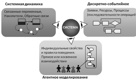
Рис. 1. Три подхода имитационного моделирования

В 1998 г. успех этого исследования вдохновил лабораторию организовать коммерческую компанию с миссией создания нового программного обеспечения для имитационного моделирования. Акцент при разработке ставился на прикладные методы: моделирование стохастических систем, оптимизацию и визуализацию модели. Новое программное обеспечение, выпущенное в 2000 г., было основано на последних преимуществах информационных технологий: объектно-ориентированный подход, элементы стандарта UML, языка программирования Java, современного GUI, и т. д.