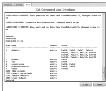
Рис. 2. Просмотр информации о VLAN на коммутаторе

На основе использования среды Cisco Packet Tracer обучающие могут спроектировать защищенную корпоративную сеть с помощью настроек VLAN, маршрутизации и NAT протокола. Платформа Cisco позволяет студентам наглядно изучить процессы функционирования сетевых устройств.